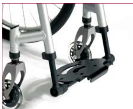
Een in hoek instelbare opvouwbare aluminium voetplaat voor de Quickie Neon VV.