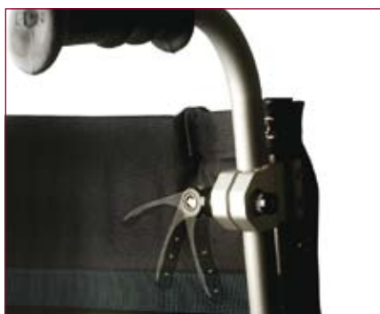
In hoogte verstelbare duwhandvatten.