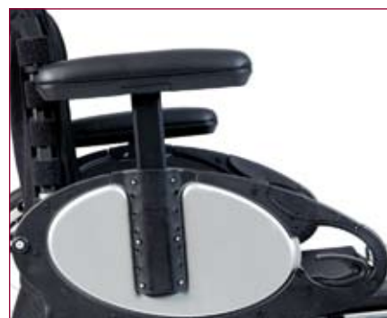
In hoogte verstelbare armsteunen.